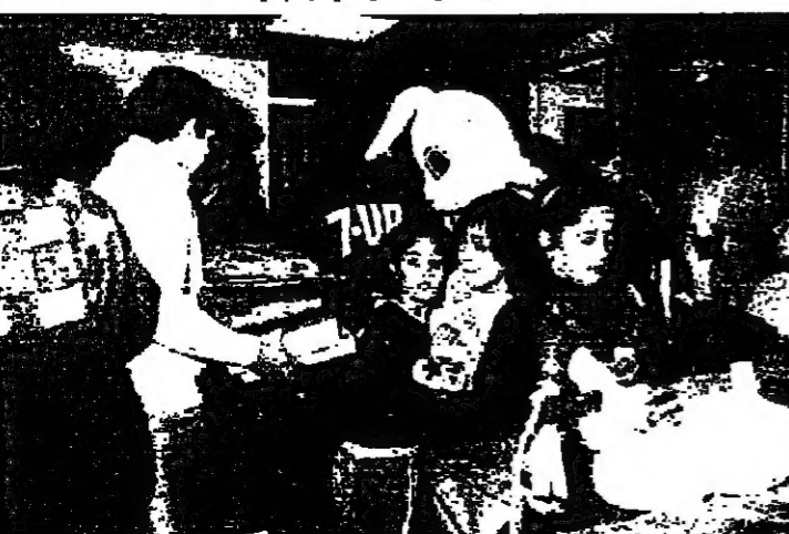
اطفال حضنة سن الليل يحملون الهدايا